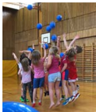
Fjör í íþróttasalnum á Reyðarfirði.