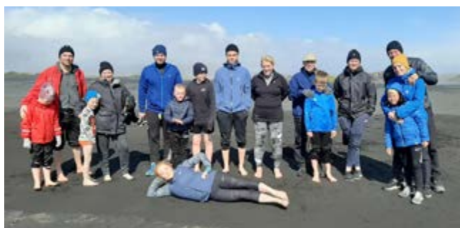
Tásurölt í mjúkum sandi á Djúpavogi í Hreyfiviku UMFÍ.