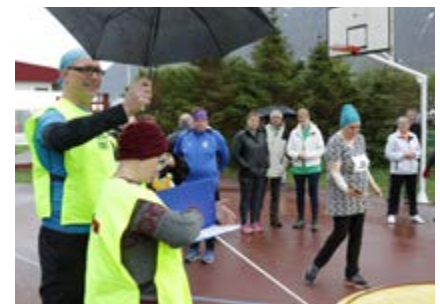
32 Takk, sjálfbóðaliðar.