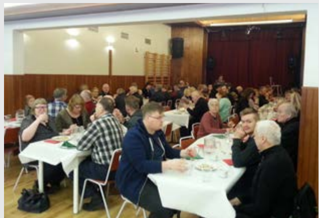
Skötuveisla á Þorláksmessu.

Stofnfundur Umf. Þjótanda var haldinn mánudaginn 16. nóvember 2015 í Félagslundum. Stofnfélagar voru 38 talsins og var fundurinn afar vel heppnaður.