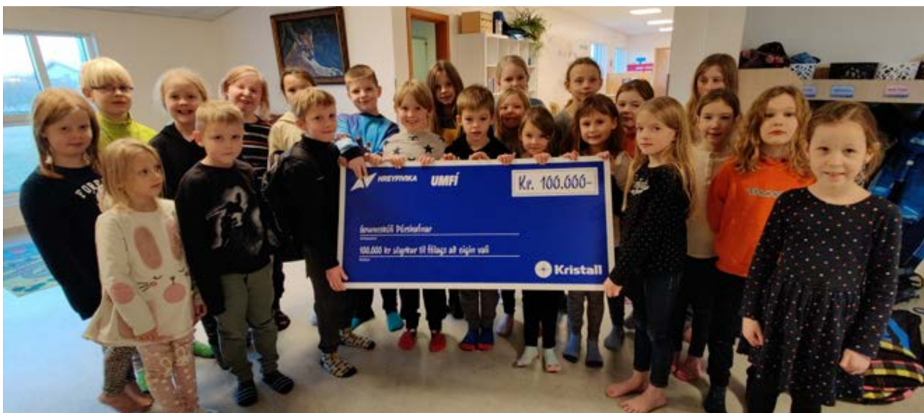
Börn í Grunnskólanum á Þórshöfn með verðlaunaávísun sem þau fengu fyrir að bera sig út býtum í Hreyfiviku UMFÍ og Kristals í sumar.

COVID-faraldurinn olli því að verðlaunin voru ekki afhent í sumar. Líklegt er að það verði gert í lok árs eða eftir því sem samkomutakmarkanir breytast.