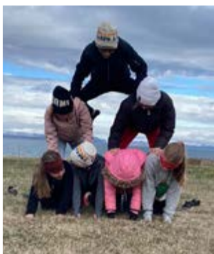
Þýramídi rís á Þórshöfn.