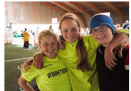
18 Þátttaka í skipulögðu íþróttastarfi rokkar.