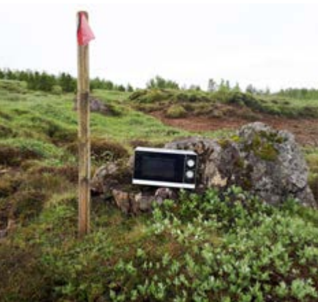
Örbylgjuofn notaður sem póstkassi í útivistarverkefni Þjótanda.

Þrjú hreppar sameinaðir í einn Flóahreppur varð til 10. júní 2006, við sameiningu þriggja hreppa í Flóanum, Gaulverjabæjarhrepps, Villingaholts-hrepps og Hraungerðis-hrepps. Í gömlu hreppunum voru starfandi ungmennafélög sem byggðu á gömlum merg, Umf. Samhygð (stofnað 1908), Umf. Vaka (stofnað 1936) og Umf. Baldur (stofnað 1908). Ungmennafélögin þrjú sameinuðust svo í Umf. Þjótanda 16. nóvember 2015.