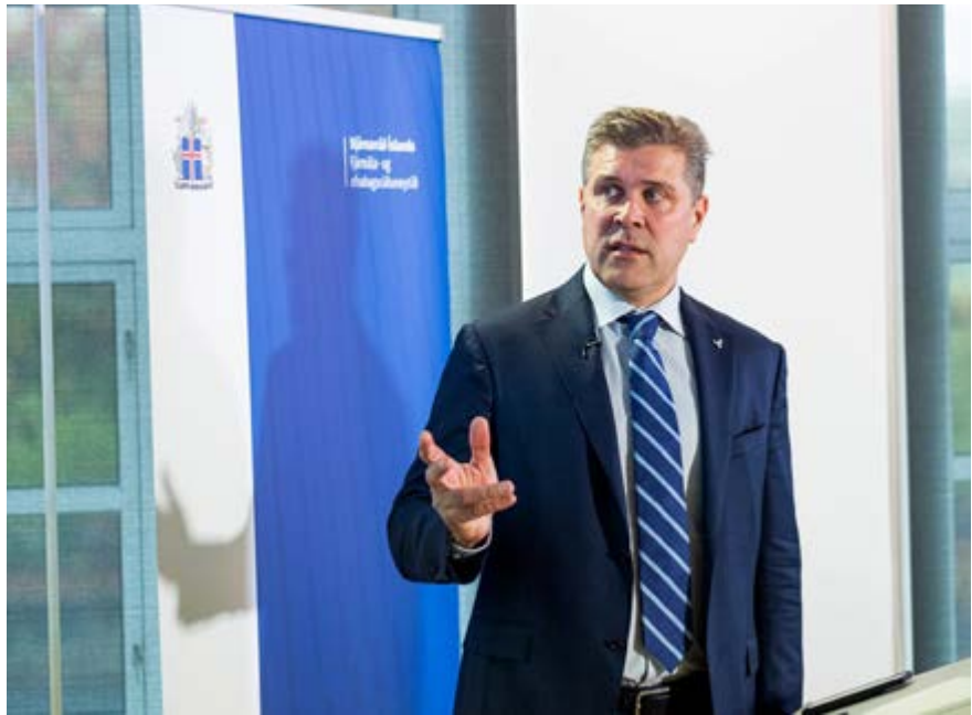
Bjarni Benediktsson fjármálaráðherra.

Það liggur beint við að spyrja Bjarna nokkurra spurninga um frumvarpið.