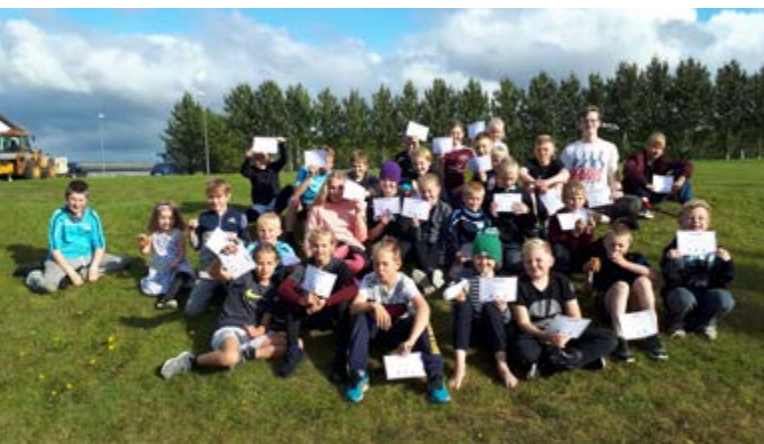
Keppendur á Flóamótinu, frjálsiþróttamóti fyrir grunnskólakrakka.