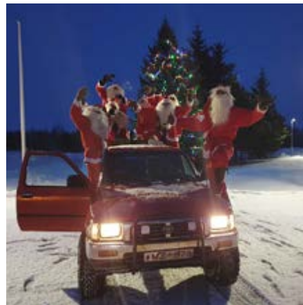
Jólasveinar á aðfangadag.