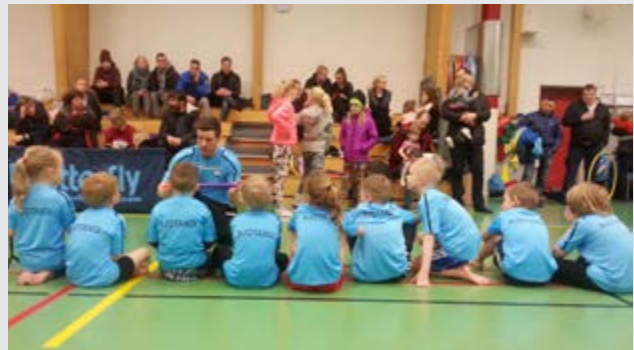
Fyrsta verk í nýja félaginu var að kaupa nýja boli til að efla andann.

4. fundur – ágúst 2015: Lögð fram drög að lögum nýja félagsins sem unnin voru upp úr lögum gömlu félaganna og lögum ÍSÍ. Farið yfir innsendar tillögur að nöfnum félagsins. Þau nöfn sem skiluðu sér inn voru: Umf. Smári, Umf. Fjóra, Umf. Þjótandi, Umf. Loftur og Umf. Flói. Ákveðið var að skólakrakkarnir í Flóaskóla fengju að kjósa nafn úr fjórum möguleikum: Umf. Fjóra, Umf. Þjótandi, Umf. Loftur og Umf. Flói. Einnig yrðu krakkarnir beðnir um að koma með uppástungu að einkennislíti félagsins. Þá var rætt um að fara með merki nýs félags inn í skólann sem myndmenntarverkefni í samstarfi við myndmenntakennara. Því velt upp hvort heiðursfélagar gömlu félaganna yrðu heiðursfélagar í nýju félagi. Ákveðið að heiðursfélagar héldu áfram nafnbótinni sem heiðursfélagar síns gamla félags en þeir yrðu ekki heiðursfélagar nýs félags.