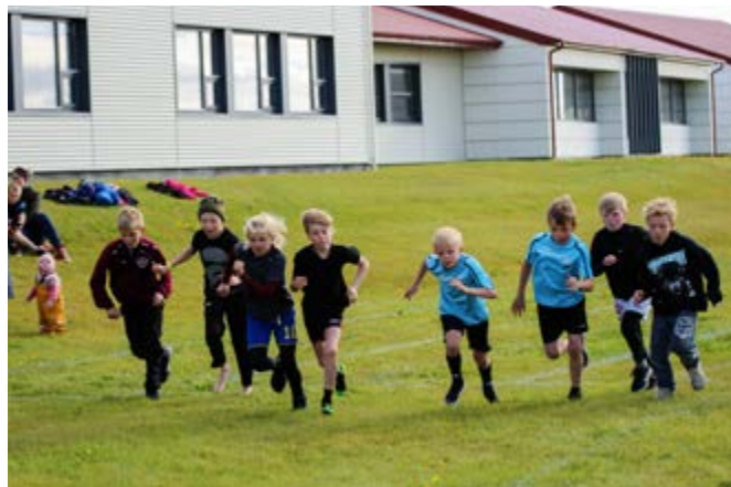
Ræst í 400 m hlaupi á Flóamótinu.