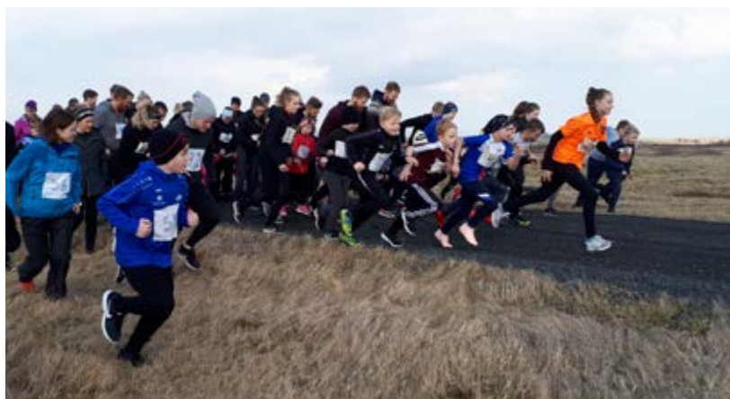
Ræst í Viðavangshlaupi Umf. Þjótanda.