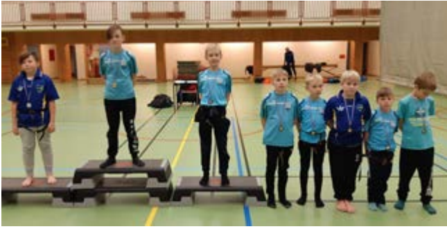
Glímuþólk Þjótanda á palli ásamt fleiri keppendum.