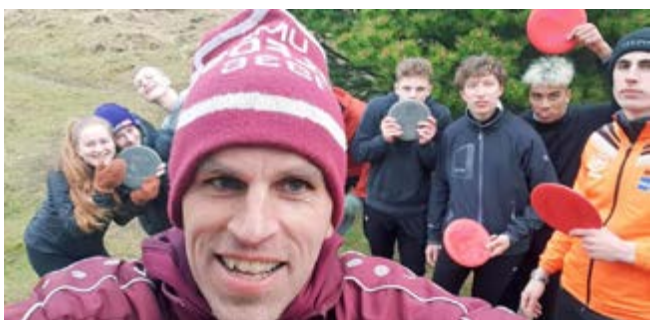
Líf og fjör í Hreyfivikunni á Selfossi.