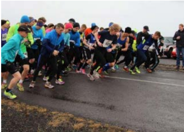
Ræst í Flóahlaupinu.

„Á þessum fordæmalausu tímum er verkefnalistinn ekki langur hjá Umf. Þjótanda. Við reynum þó að funda einu sinni í mánuði á Teams, í þeirri trú að COVID sé að klárast. Það hefur farið þannig að öllu hefur verið frestað nema við náðum þó að halda Flóahlaupið í júní og Flóamótið í september. Einnig vorum við með útivistarverkefni sem hitti í mark hjá íbúum á tímum COVID. Verkefnið var með sex stöðum sem fólk gat heim-sótt og kynnt sér sögu og staðhætti. Stuðlaði það að hreyfingu, útiveru og fjölskyldustund. Í venjulegu ári höldum við úti hátt í 20 verkefnum/ viðburðum en núna er það miklu minna. Vikulega eru íþróttæfingar eftir skóla, þrír hópar sem mæta einu sinni í viku 1,5 klst. í senn. Einnig erum við með glímuæfingu einu sinni í viku í tveimur hópum. Þessar æfingar eru gjaldfrjálstar og mjög vel sóttar. Fram undan hjá félaginu er sala á peysum merktum félaginu og að styðja jólasveinana við að keyra pakka á milli bæja. Einnig er í gangi undirbúningur að því að setja upp frisbygolfvöll þegar vorar. Með von um bjartari tíð og vonandi án COVID.“