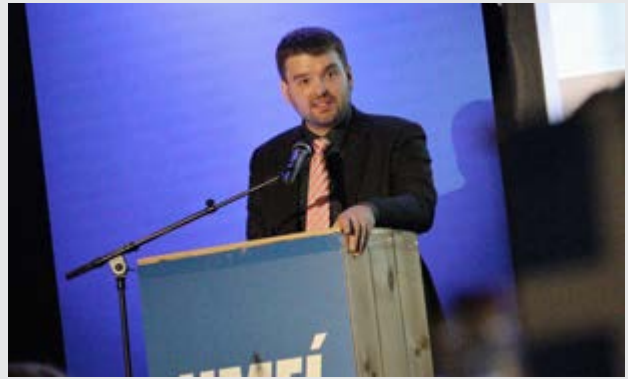
Ásmundur Einar Daðason, félags- og barnamálaráðherra.

Lilja og Ásmundur voru bæði himinlifandi með niðurstöðuna á samfélagsmiðlum, fögnuðu henni og þökkðu öllum sem komu að málinu, sérstaklega var samvinnan við íþróttahreyfinguna mikilvæg.