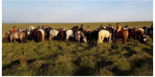
Árlegur reiðtúr Þjótanda.